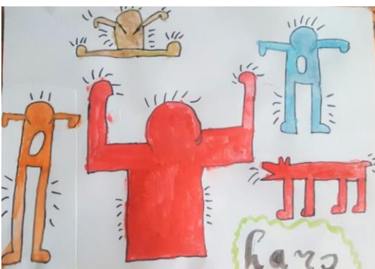
gemaakt door leerling uit groep 5 (thuis met waterverf)