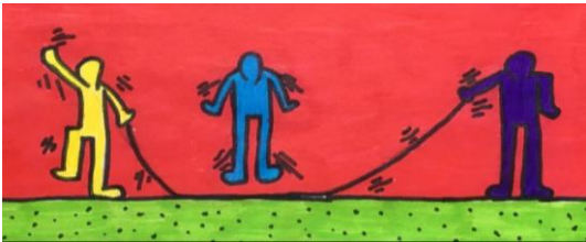
gemaakt door leerling uit groep 6

! Voor de bovenbouw, stel ook als eis dat de leerlingen complementaire kleuren kiezen om hun werk mee te vullen.